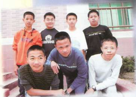
阿公！你要跟攝影的蟹家哦(台)