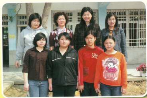
怡仲老師怎麼還在睡?!