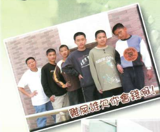
雞屎誰欠你會錢啊!