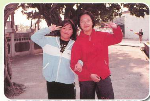
你看有人偷拍我們！乾脆比YA