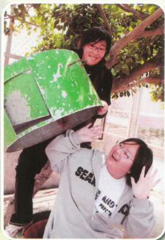
看我怎麼擺平你這隻飛天少女豬