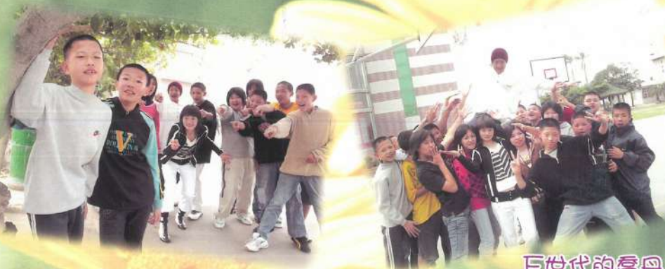
跟咕嚕拍照，好難得！