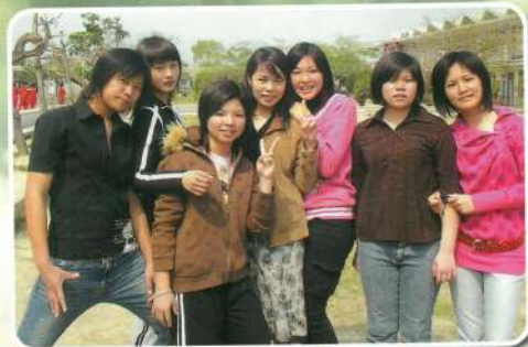
欣存你在為難什麼?