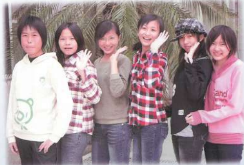
“閃亮”六姊妹~POS擺得不錯啲~