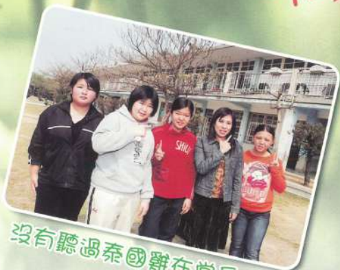
沒有聽過泰國雞在當兵哦!