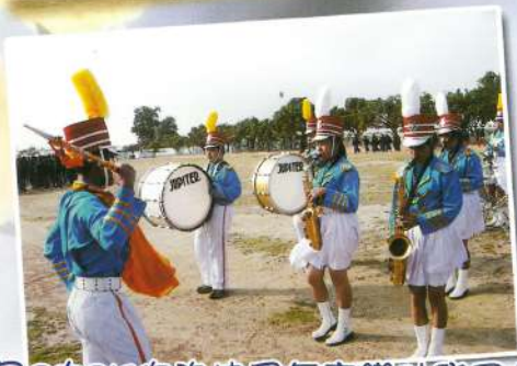
Deter你的披風怎麼變肚兜了!