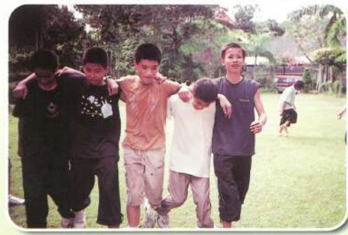
看我們發揮男性本能“衝”