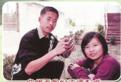
你們兩個好不速配哦