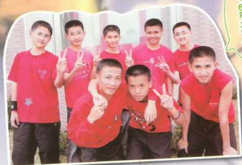
假冒經十字會來布中 散播邪惡~~興幫