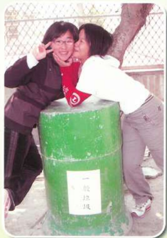
怡楨真三八，偷親我 福仔起床了，怎麼還在睡