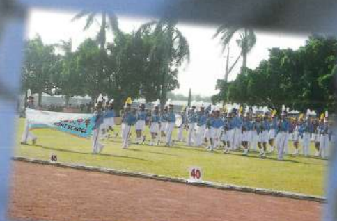
看我們的隊伍... 雄壯威武 聽我們的樂聲... 響徹雲霄 看前面的指揮... 有夠@@