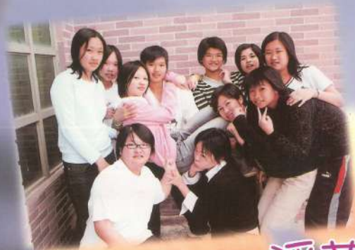
咩~你那眼神好.... 淫蕩