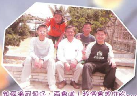
親愛滴阿炯仔，再會啦！我們會想你的...