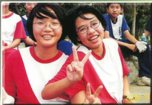
滾輪胎還沒比，高興什麼勁啊!!