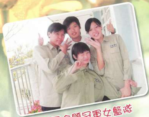
稱霸全縣冠軍女籃隊