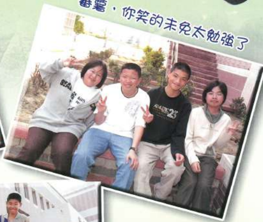
蕃薯，你笑的未免太勉強了