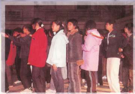
拍舞:大家都在看我?!