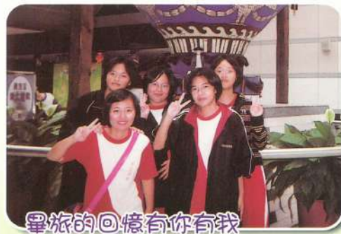
畢旅的回憶有你有我 才讓這趟旅行不孤單不寂寞