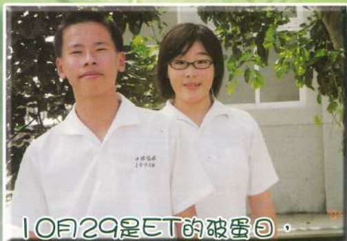
10月29是ET的破蛋日，無緣無故送一隻猴子讓我當禮物

你又想模仿TORO的舞姿了 古錐的社會老師 有環遊世界的精神(迪斯奈電影) 想當黑社會老大門都沒有