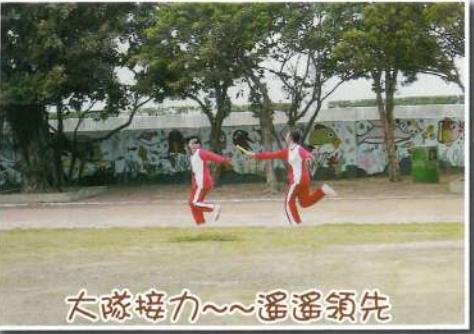
大隊接力~~遥遥領先