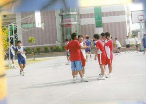
嵐姊教戰術.....(拍舜你在幹嘛)