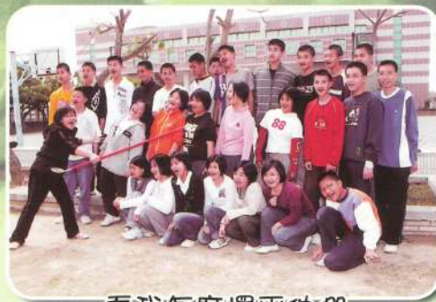
看我怎麼擺平他們