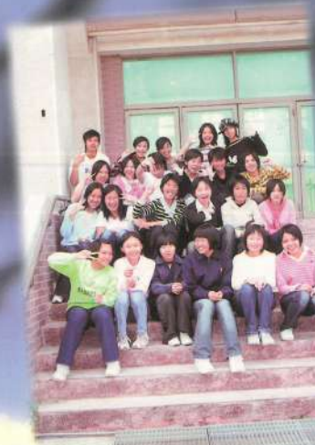
女生大合照~真水哦！