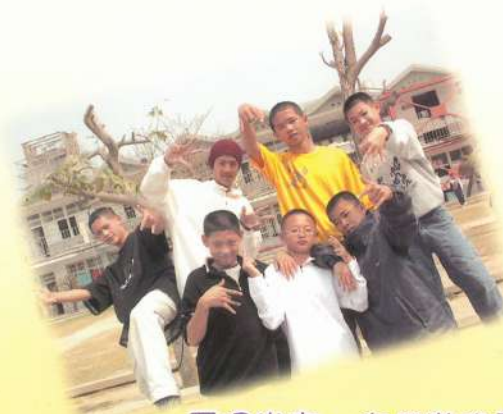
看得出來，你們常跑轟趴丕！