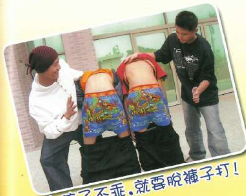
小孩子不乖,就要脫褲子打!