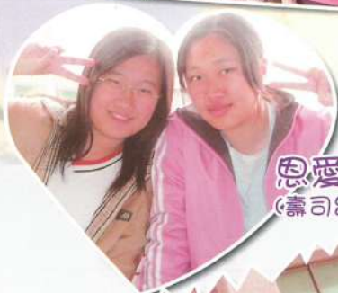
恩愛呢！ (壽司出軌了)