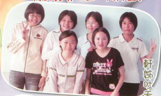
軒姊吐舌頭！美麗加分？